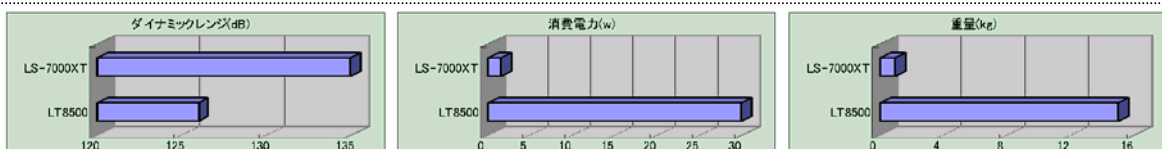
当社テレメータ製品 LT8500 との比較 (100Hz サンプリング 6 チャンネル計測時)