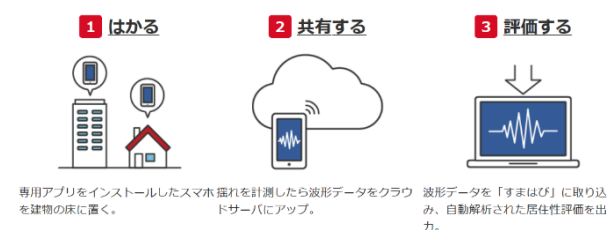
すまはび利用方法