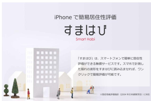
すまはび特設サイト トップページ

※2：簡易評価結果は詳細な検証・評価を行った場合と、結果が異なる場合があります。