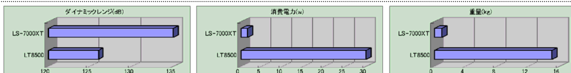
当社テレメータ製品 LT8500 との比較 (100Hz サンプリング 6 チャンネル計測時)